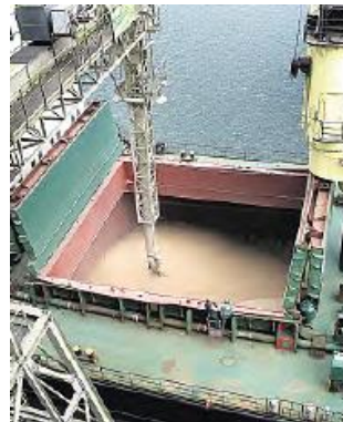
Експорт суднами через термінали