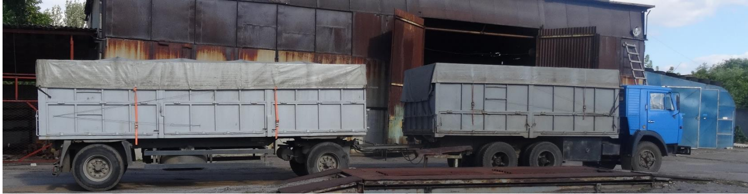
Транспортування зернових насипом