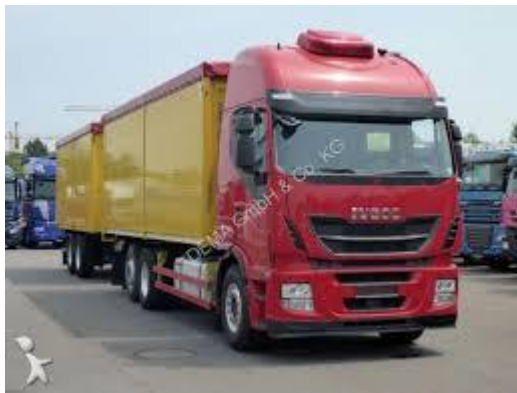
Експорт в опломбованих біг бегах на вантажівках